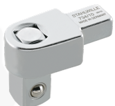
58240010 Vierkant- Einsteckwerkzeug