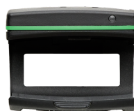
52110220 Bluetoothmodule für Drehmomentschlüssel