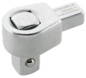
58240020 Vierkant- Einsteckwerkzeug