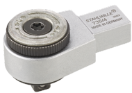
58250004 Feinzahn- Einsteckknarre