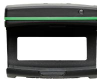
52110220 Bluetoothmodule für Drehmomentschlüssel