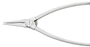
65454102 Sicherungsringzange f.Außenringe