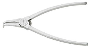
65464121 Sicherungsringzange f.Außenringe