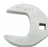
03501069 CROW-FOOT-Schlüssel heavy-duty