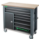
85010621 Mobile Werkbank