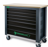
85010625 Mobile Werkbank