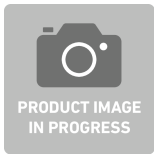
83020202 Hartschaumeinlage f.Garniturenkasten