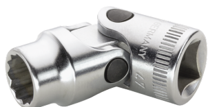
02040019 Gelenk- Steckschlüsseleinsatz