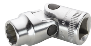
02040018 Gelenk- Steckschlüsseleinsatz