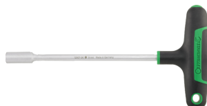
43233130 Sechskant- Steckschlüssel