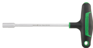
43233080 Sechskant- Steckschlüssel