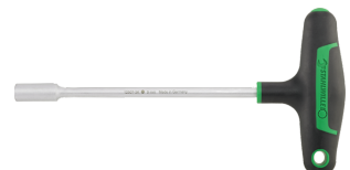
43233100 Sechskant- Steckschlüssel