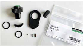
19021020 Knarren-Ersatzteil- Satz