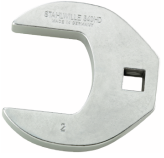
02501060 CROW-FOOT-Schlüssel heavy-duty