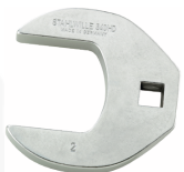
02501046 CROW-FOOT-Schlüssel heavy-duty