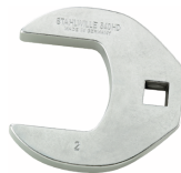
02501036 CROW-FOOT-Schlüssel heavy-duty