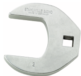
02501042 CROW-FOOT-Schlüssel heavy-duty