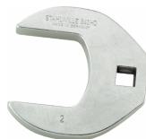
02501048 CROW-FOOT-Schlüssel heavy-duty