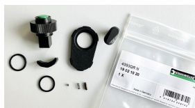
19021020 Knarren-Ersatzteil- Satz