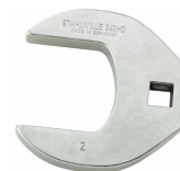
02501054 CROW-FOOT-Schlüssel heavy-duty