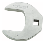
02501058 CROW-FOOT-Schlüssel heavy-duty