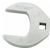
02501046 CROW-FOOT-Schlüssel heavy-duty