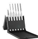
96700712 Splintreiber- und Körner-Satz