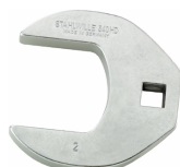
02501046 CROW-FOOT-Schlüssel heavy-duty