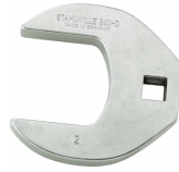
02501052 CROW-FOOT-Schlüssel heavy-duty