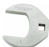
02501038 CROW-FOOT-Schlüssel heavy-duty