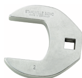
02501028 CROW-FOOT-Schlüssel heavy-duty