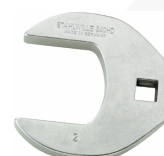
02501042 CROW-FOOT-Schlüssel heavy-duty