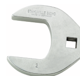
02501034 CROW-FOOT-Schlüssel heavy-duty