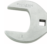
02501062 CROW-FOOT-Schlüssel heavy-duty