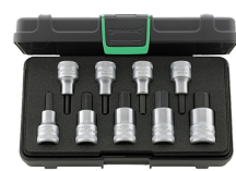
91332215 Satz Schraubendrehereinsatz Z