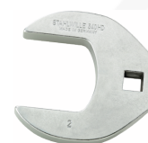
03501069 CROW-FOOT-Schlüssel heavy-duty