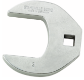
03501072 CROW-FOOT-Schlüssel heavy-duty