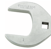
03501069 CROW-FOOT-Schlüssel heavy-duty