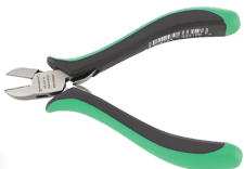
67076000 Elektronik- Seitenschneider