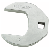
03501064 CROW-FOOT-Schlüssel heavy-duty