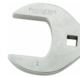
03501072 CROW-FOOT-Schlüssel heavy-duty