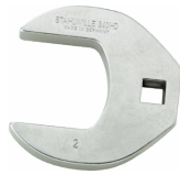
03501076 CROW-FOOT-Schlüssel heavy-duty