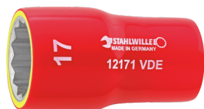
02380008 VDE- Steckschlüsseinsatz