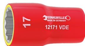
02380007 VDE- Steckschlüsseinsatz