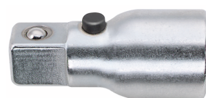
13011001 QR- Steckschlüsselverlänge- rung