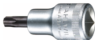
03100020 Schraubendrehereinsatz Z