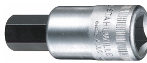
03050017 INHEX- Schraubendrehereinsatz Z