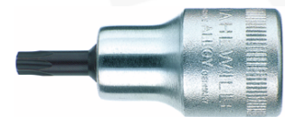
03100027 Schraubendrehereinsatz Z