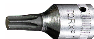
01350009 Schraubendrehereinsat z