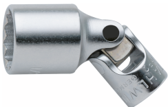
01540020 Gelenk- Steckschlüsseleinsatz