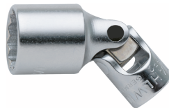
01540028 Gelenk- Steckschlüsseleinsatz