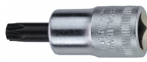
02100027 Schraubendrehereinsatz z