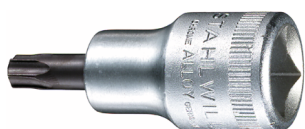
03100045 Schraubendrehereinsatz z