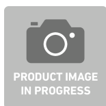
83092013 Hartschaumeinlage f.Garniturenkasten