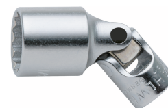
01540028 Gelenk- Steckschlüsseinsatz