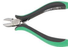
67076000 Elektronik- Seitenschneider